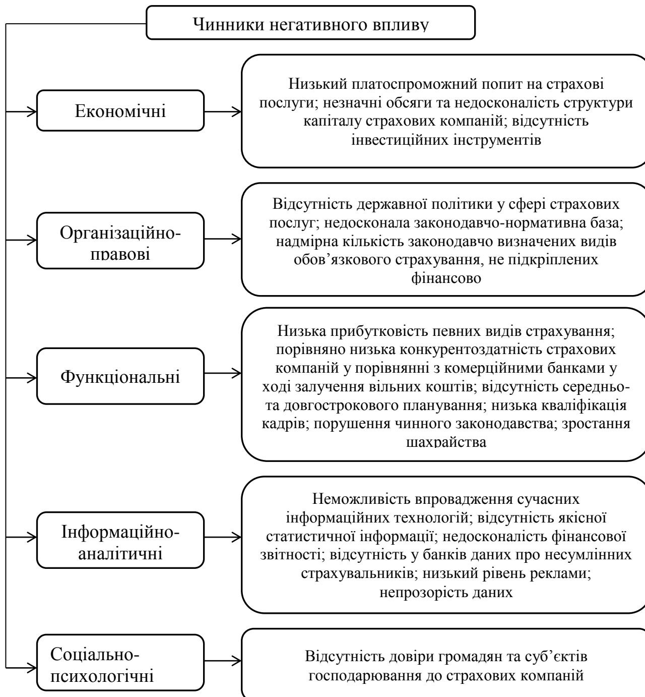
Рис. 3 – Чинники негативного впливу на розвиток страхового ринку в Україні