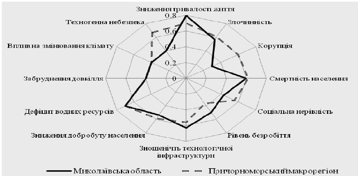
Рис. 3. Загрози сталому розвитку в Миколаївській області, 2013 рік [8]

Загроза зниження тривалості життя в досліджуваній області має критичні максимальні в межах країни значення – 1 місце. За загрозами злочинності область на 11 позиції у рейтингу, за загрозою корупції – 20. Загрозу соціальної нерівності демонструє Індекс Джині, який у Миколаївській області не набуває критичних значень – 16 позиція в рейтингу серед інших областей.